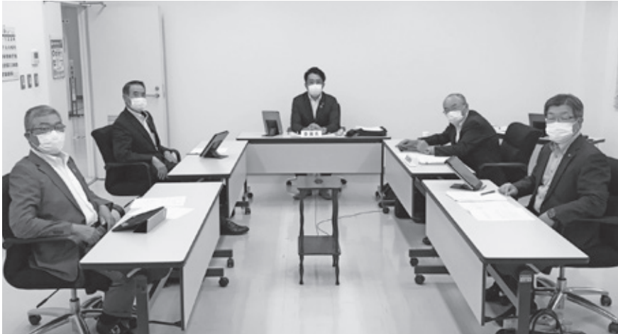
▲説明を受ける委員 (千代田庁舎委員会室)

● 請願第4号 教職員定数改善と義務教育費国庫負担制度堅持のための政府予算に係る意見書採択を求める請願について ● 閉会中の所管事務調査の申し出について