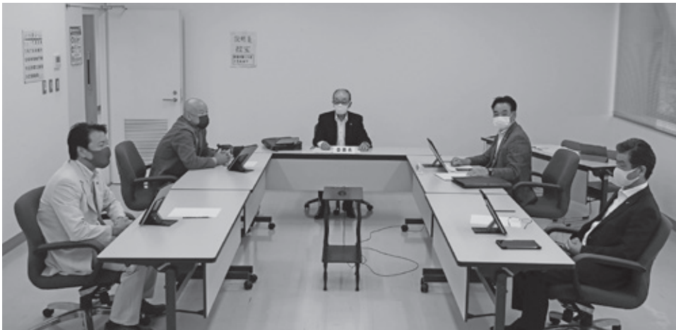
▲説明を受ける委員 (千代田庁舎委員会室)