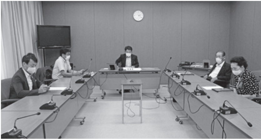
▲説明を受ける委員 (千代田庁舎全員協議会室)