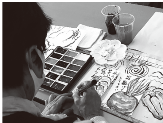
絵手紙を描く様子