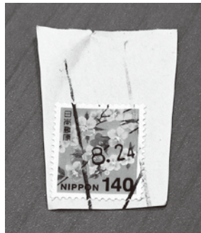
消印が切り取られたもの