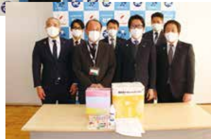
土浦青年会議所 様