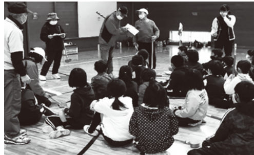
10/22 グラウンド・ゴルフ体験