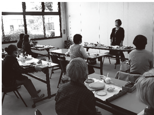
描き方について講義を受ける様子