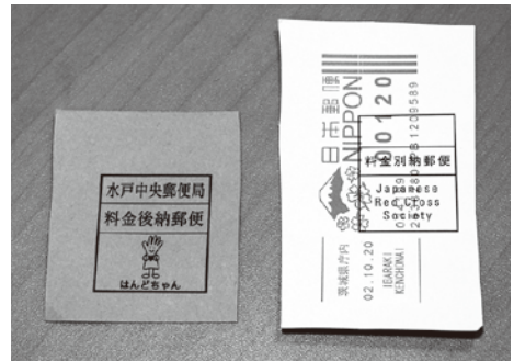
メータースタンプや郵便料金計器で印字されたもの等