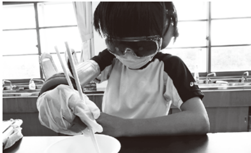
7/14 インスタントシニア体験