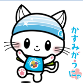
市公式キャラクター

かすみがうら市では学生消防団活動認証制度を導入しております。大学生等から認証証明書の提出があった際は、積極的な評価を頂きますようお願い申し上げます。