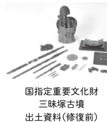
国指定重要文化財 三味塚古墳 出土資料（修復前）