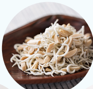
おつまみ しらうお