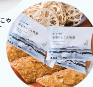
帆引れんこん物語 (アーモンドとれんこんの焼き菓子)