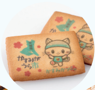
かすみがうら サブレ