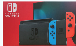
Nintendo Switch 本体