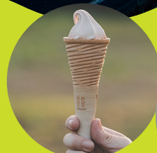
マロンソフトクリーム