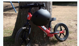
子供用ランニングバイク