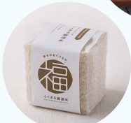
ふくまる厳選米(キューブ)