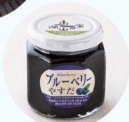
ブルーベリージャム