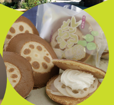
レンコンどら焼き