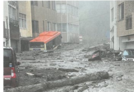
▲大雨災害による甚大な被害(熱海市)