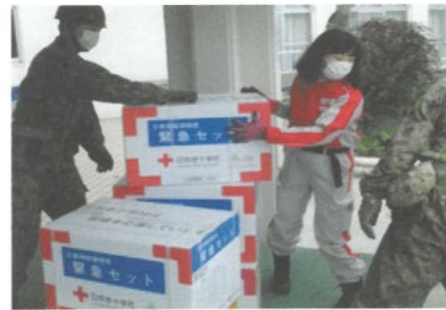
▲救援物資を搬送する日赤職員