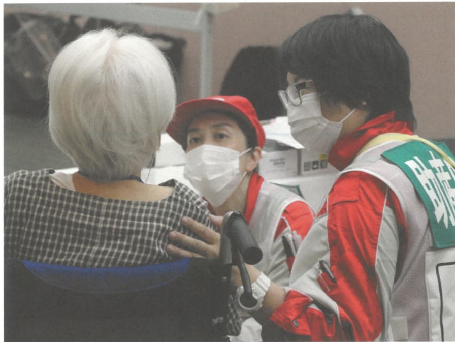
▲避難者の健康相談を行う日赤職員

これからも、日本赤十字社が災害や紛争で苦しむ人々を救い続けるため、皆さまのご支援を必要としています。