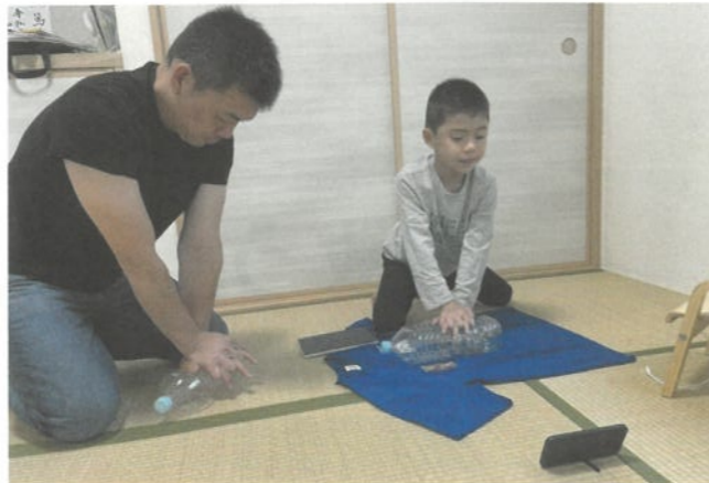
▲オンラインで救急法講習を受ける親子

赤十字の講習は、自分自身はもちろん、「人のいのちと健康、尊厳を守る」知識や技術を伝えています。コロナ禍においても、感染防止等の対策を講じて、各講習を実施しています。