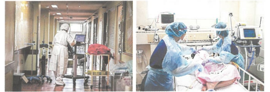
▲新型コロナウイルス感染者に対応する医療スタッフ

茨城県支部ではコロナ禍でも災害救護を柱として、看護師の養成、救急法等の講習、ボランティアの養成、青少年赤十字の育成、国際支援活動など「ひとを救う」ための活動を続けています。