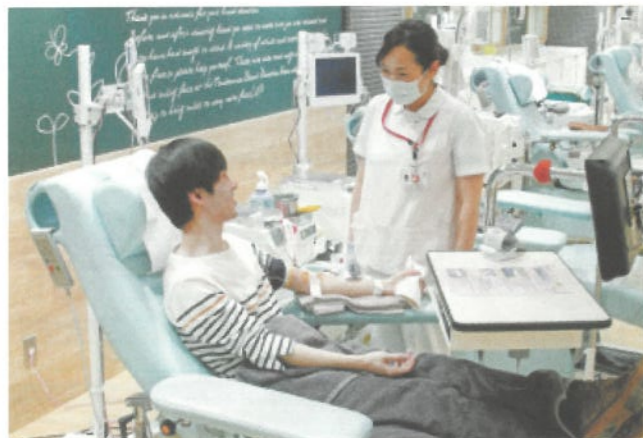
▲献血ルームでの協力者

日本赤十字社は、血液を提供していただける方(献血者)を募集し、24時間体制で全国の医療機関にお届けしています。献血は不要不急にはあたりません。ぜひ献血にご協力をお願いします。