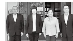
教育相談員がお子さんを支えます