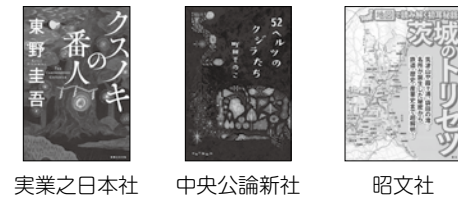
実業之日本社 中央公論新社 昭文社