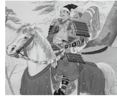
▲歴史画「勿来の関の八幡太郎義家」