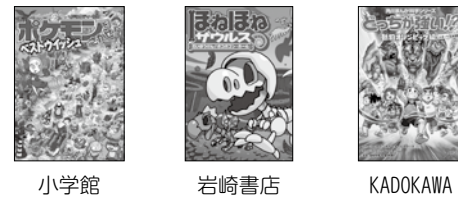
小学館 岩崎書店 KADOKAWA