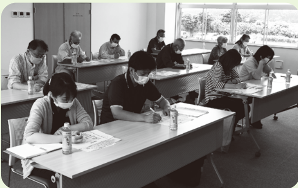
霞ヶ浦中地区協議体の皆さん