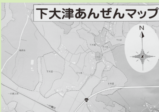
下大津地区の各戸に配布されたマップ (A1サイズ両面4つ折り)