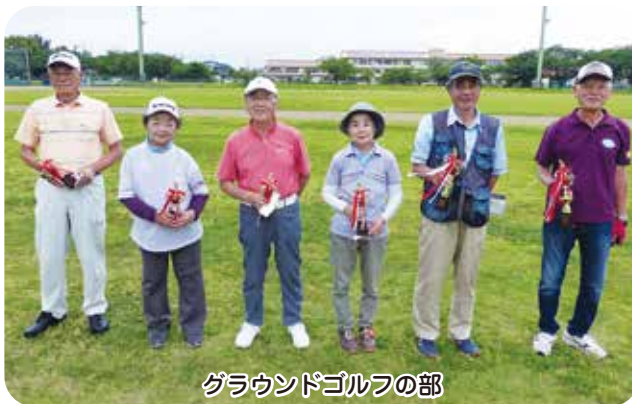
グラウンドゴルフの部