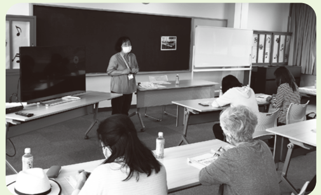
戸田講師による説明