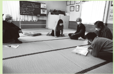
バザーについての話し合い