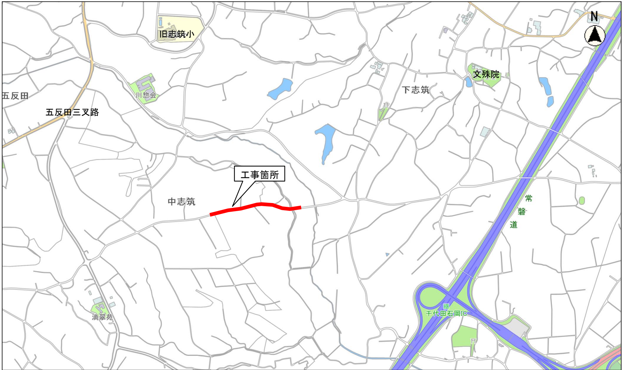
縮尺 1 : 10000 A scale bar with markings at 0, 100, and 200 meters.