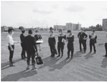
▲複合交流拠点施設等整備事業に係る現地調査状況【稲吉南二丁目地内】