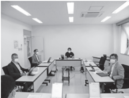
▲説明を受ける委員【千代田庁舎委員会室】