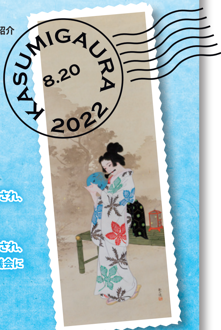
▲伊藤幾久造作『蛭』 (かすみがうら市歴史博物館所蔵)

◆市議会議員の補欠選挙が執行され、 3名の方が新たに議員として議会に 加わりました。