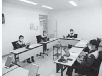
▲説明を受ける委員【千代田庁舎委員会室】