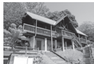
▲三ツ石森林公園(もりの小屋)

A 自然環境整備交付金(補助率45%)を活用し、三ツ石森林公園内にある東屋やベンチなど、園内の老朽化した設備をリニューアルするものです。