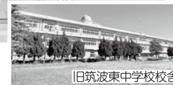
旧筑波東中学校校舎