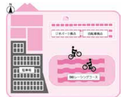
拠点配置イメージ図