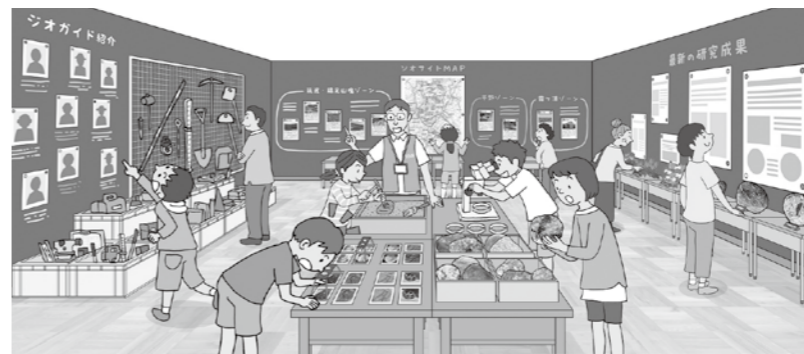
ジオパーク展示イメージ

宣誓・請求日、氏名、住所、生年月日を記入し、投票日に投票できない理由を丸で囲んでください。