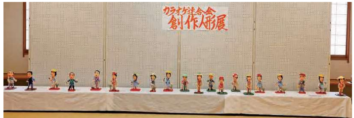
かすみがうら市カラオケ連合会