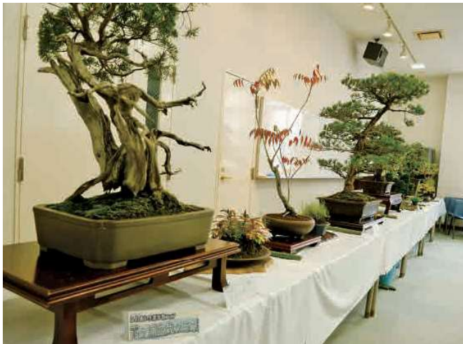
霞ヶ浦盆栽クラブ

10月15日と16日は、展示団体による発表があじさい館で行われましたので、その一場面を写真でお伝えします。