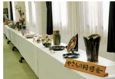
千代田やきもの同好会