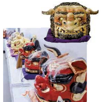
獅子頭彫刻同好会