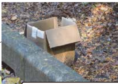
柏崎（石岡田伏土浦線）