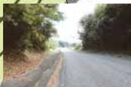
田伏（石岡田伏土浦線バイパス）