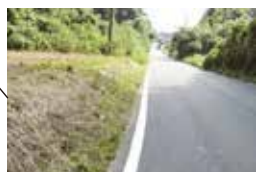
大和田（霞ヶ浦庁舎付近）