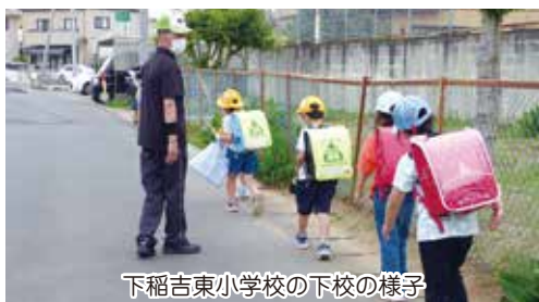
下稲吉東小学校の下校の様子

下稲吉小学校・下稲吉東小学校の児童の皆さんの下校時間の見守り活動を行っています。現在地域の皆さん約30名が参加。ペットの散歩やジョギングの時間を下校時間に合わせて活動しています。児童の皆さんの安全確保だけでなく、地域のみなさん同士の声かけにもつながり、ご近所との交流も生まれます。