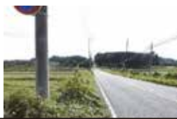
馬場山交差点を荻平本郷方面へ