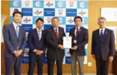
土浦北ライオンズクラブ 様