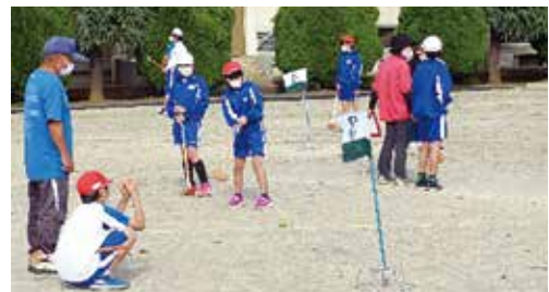
ホールポストをめがけて！