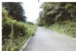
石岡田伏土浦線から外葉方面へ