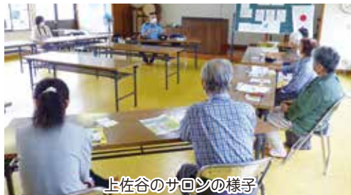
上佐谷のサロンの様子