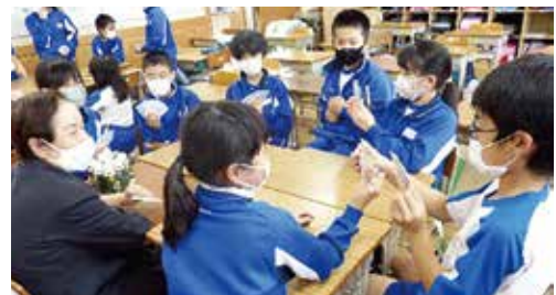
地域の皆さんと楽しい一時♪