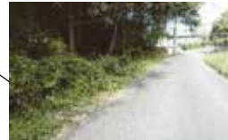
田伏（農村集落センター付近）