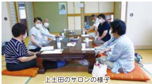
上土田のサロンの様子