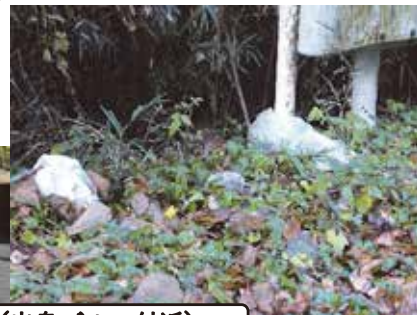
下軽部（出島ゴルフ付近）