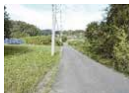
三ツ谷風返入口（鹿島神社北側）