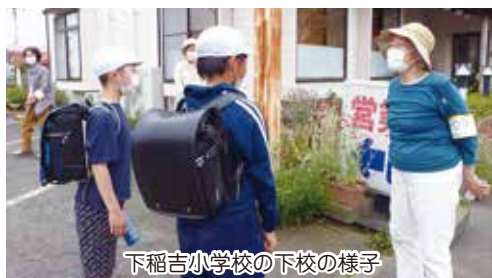
下稲吉小学校の下校の様子