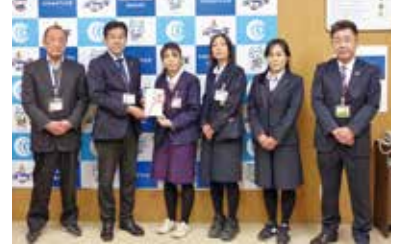
水戸ヤクルト販売株式会社 様