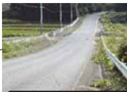
志土庫駐在所から旧志土庫小学校方面へ