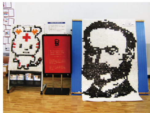
ボトルキャップで作成したデュナン像