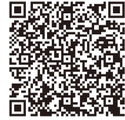
「キモチと。」の日赤ページ