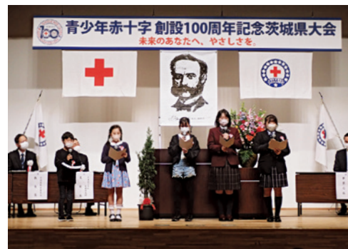
誓いの言葉を読み上げるJRCメンバー