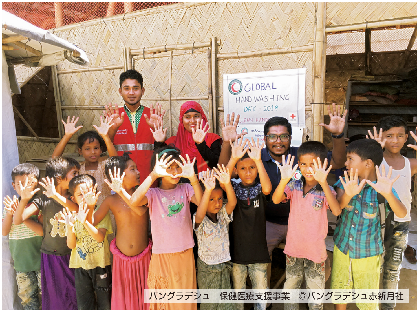
Bangladesh 保健医療支援事業

日本赤十字社は、世界中の災害や紛争、病気などに苦しむ人々を救うため、世界最大の赤十字のネットワークを活かして、緊急時の救援や復興支援、感染症予防活動に取り組んでいます。