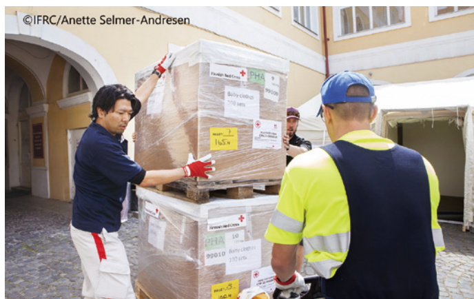
現地で医療資機材を運ぶ日赤の薬剤師

2022年2月以降、ウクライナ各地で戦闘が激化。日々、子どもを含む死傷者が多数報告され、多くの人びとがウクライナ西部及び周辺国（ポーランド・ハンガリー・スロバキア・モルドバ・ルーマニア・ロシア・ベラルーシ）やその他の国々に避難するなど極めて深刻な人道危機が起こっています。