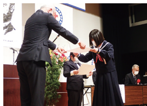
賞状を受け取るJRCメンバー