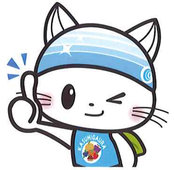
かすみがうら市公式キャラクター かすみがうらにゃ