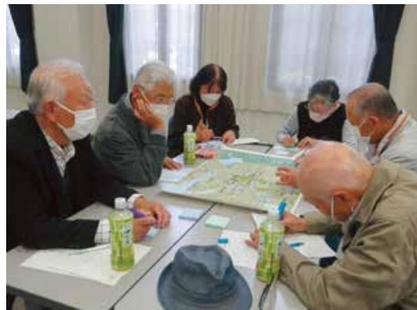
R4 再発見！かすみがうらの魅力をもう一度覗いてみよう