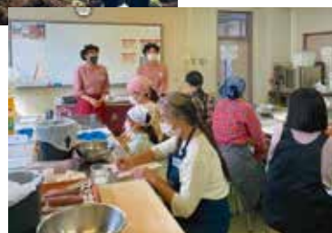
さつまいもまるごと使ったスイーツポテトづくり