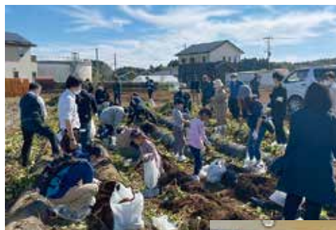
芋掘り収穫を楽しみましょう！