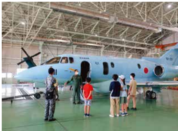
R4 空の警察 百里基地を知ろう！