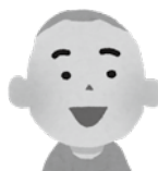
兄 / 5歳 認定こども園に通園