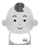
弟 / 0歳 市立保育所に通所