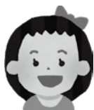
妹 / 2歳 民間保育園に通園