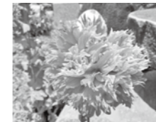
ケン(八重) 【ソムニフェルム種】