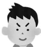
兄 / 10歳 小学4年生