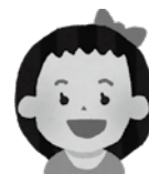
妹 / 2歳 市立保育所に通所