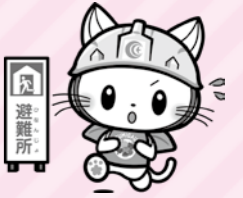
図 危機管理課 (千代田庁舎)

大正 12 年(1923)9 月 1 日、甚大な被害を出した関東大震災。今年は、その発生から 100 年の節目になります。主に火災により、10 万人以上の方が亡くなり、東京や横浜では 6 割の家屋が破損するなど、多くの住民が家族と住居を失いました。