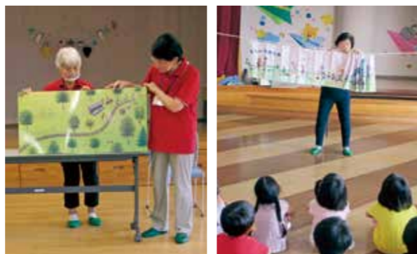
保育所での読み聞かせの様子

読み聞かせのボランティアグループ「つくしんぼの会」は、平成3年9月に発足し、今年で32年になりました。10人の会員が、毎年7月と11月に保育所や幼稚園を回り、読み聞かせを行っている他、各児童クラブや福祉施設へ出向するなど、積極的に活動。大きな絵本や絵の描かれたカーテンを巧みに操り、子どもたちの心をつかんでいます。興味のある方は、図書館(☎029-897-0647)へお問い合わせください。