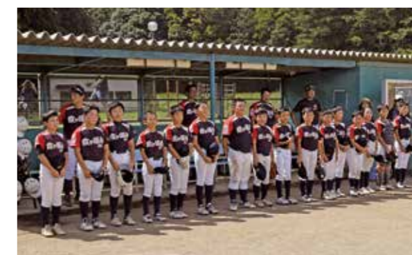
第1位：霞ヶ浦南スポーツ少年団の選手