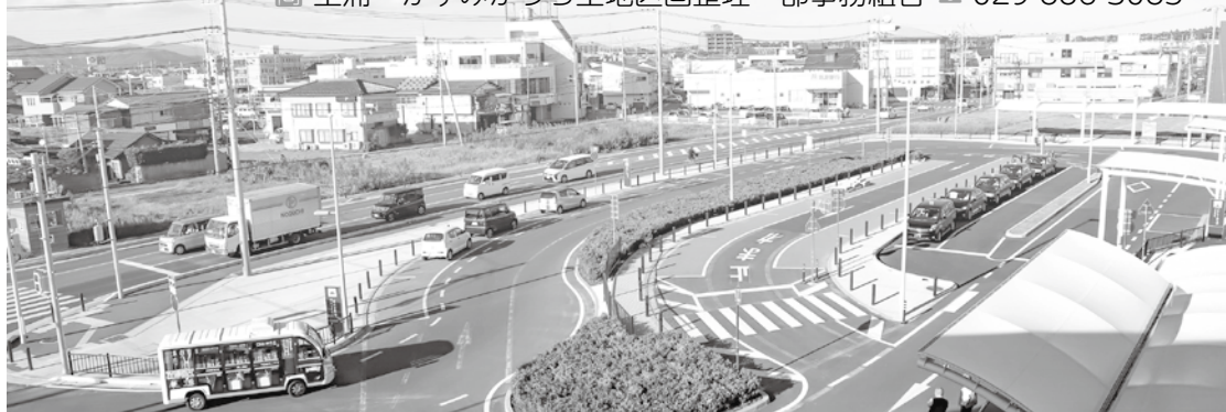
【写真】神立駅西口駅前広場