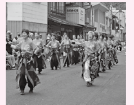
▲よさこいソーラン