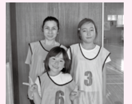
▲スポーツ鬼ごっこ