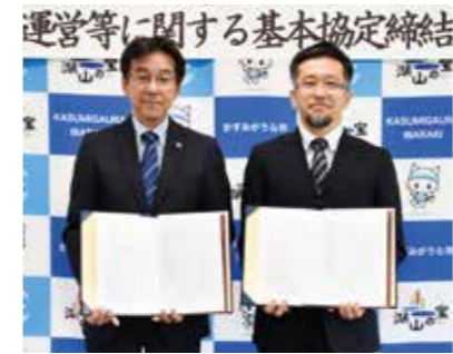
▲(左から)宮嶋市長、医療法人社団青洲会平塚理事長