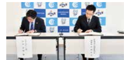
▲協定書へ署名する様子