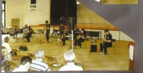
かすみかうらサクソフォンクラブ

昨年の「コロナに負けるなコンサート」は大好評を得ましたので、名称を「スマイルコンサート」へ変更のうえ定期演奏会にし、第1回目が5月28日に千代田講堂で開催されました。公民館活動等を通じて活動している5チームが出演し、多様なジャンルの音楽が披露されました。参加総数約120名が、楽しい時間を過ごしました。