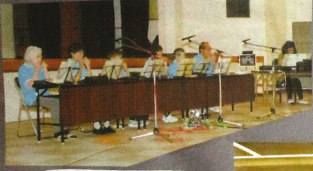
かすみかうらハーモニカクラブ