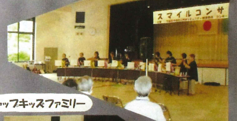
キャップキッズファミリー