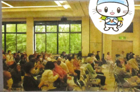
笑顔が溢れる観衆の方々