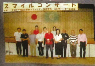
実行委員会のメンバー