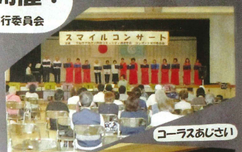
コーラスあじさい