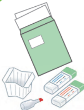
(尿容器) (大腸検査キット)