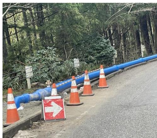
仮設管復旧 PP200 mm