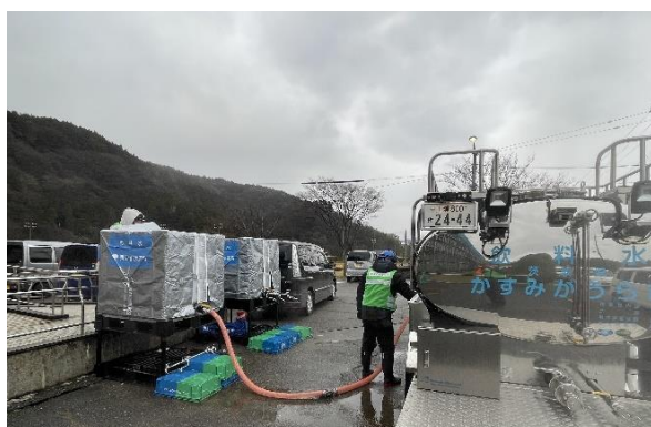
本市給水車から現地給水タンクへ補水

第2次 2/7~12 輪島市門前町体育館仮設タンク 1 m 3 ×2、特別養護老人ホーム受水槽 1 m 3 、小学校仮設タンク 1 m 3 、消防分署 1 m 3 及び歯科医院 (6日間) 1日当 5 m 3 ~7 m 3 給水