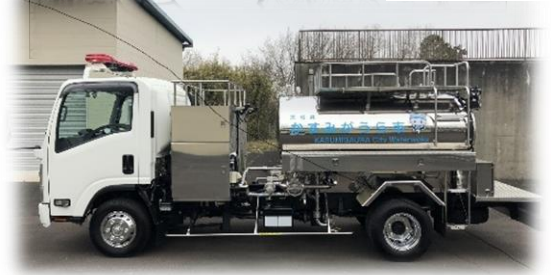
(本市給水車 3 m 3 )