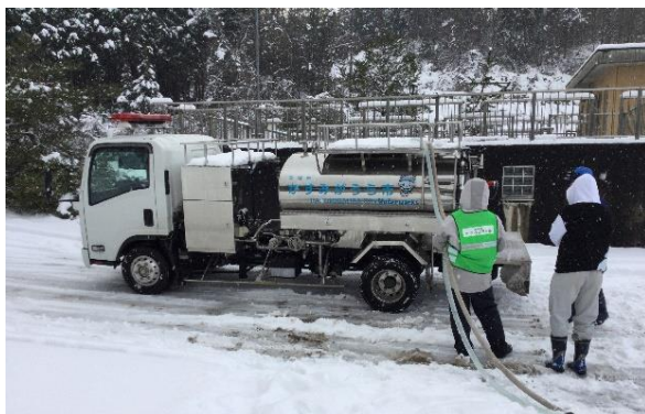
現地浄水場から本市給水車へ受水中

第1次 1/22~27 志賀町文化センター1 m 3 、輪島市門前町体育館仮設タンク 1 m 3 、特別養護老人ホーム受水槽 1 m 3 、消防分署 1 m 3 及び市避難所 1 m 3 (6日間) 1日当 5 m 3 ~7 m 3 給水