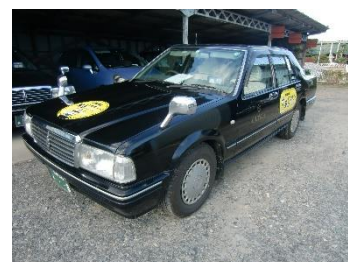
(デマンド型乗合タクシー運行車両)