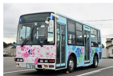
（千代田神立ライン運行車両）