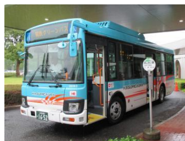
（霞ヶ浦広域バス運行車両）