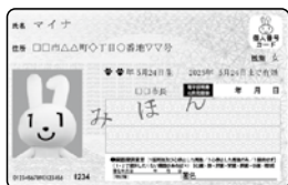
マイナンバーカード (マイナ保険証申込済み)