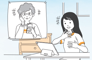
●家族や友人との会話