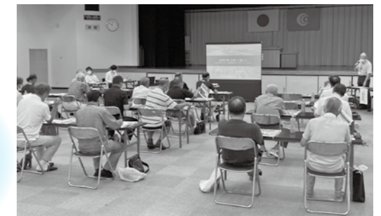
▲過去の出前講座の様子

今年度も「まちづくり出前講座」を実施しますので、次のページから始まる「出前講座一覧」から選択し、地域コミュニティ課(霞ヶ浦庁舎)へご相談ください。