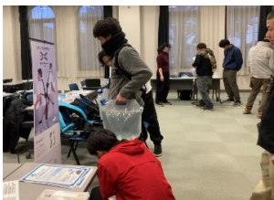
農業次世代技術のマッチング会の様子