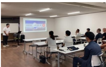
脱炭素ワーケーションのプレゼン大会の様子

効果：企業誘致やワーケーションの実施により、本市の地域経済の活性化、税収の増加、新規ビジネスの創出、関係人口の確保、持続可能なまちづくりへの機運の醸成、新たな雇用の創出や本市への移住・定住が見込まれるなど、様々な効果を見出した。