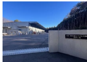
戸崎地内に新設された(株)サンエス工業の茨城工場【R4年度～優遇制度活用】