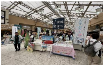
茨城産直市での観光PR(JR上野駅)

【効果】地域資源を魅力的に発信するプロモーション動画の作成、市公式キャラクターを積極的に活用した観光PRを展開したことで、観光交流人口や関係人口の増加に繋げることができた。また、多面的な観光PRを展開すべく、LINEやインスタグラムのSNS等を活用した各種キャンペーンを実施し、多くの人に本市の魅力を発信することができた。