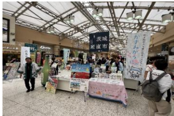
茨城産直市での観光PR(JR上野駅)

【効果】 地域資源を魅力的に発信するプロモーション動画の作成、市公式キャラクターを積極的に活用した観光PRを展開したことで、観光交流人口や関係人口の増加に繋げることができた。また、多面的な観光PRを展開すべく、LINEやInstagramのSNS等を活用した各種キャンペーンを実施し、多くの人に本市の魅力を発信することができた。