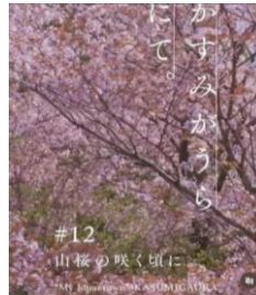
雪入地区の山桜動