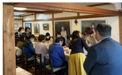
■市主催カップリングパーティー

・空き家バンクリフォーム補助金、わくわく茨城移住支援金、市移住促進住宅取得支援金など、移住定住促進