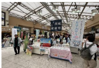
茨城産直市での観光PR(JR上野)

【効果】 地域資源を魅力的に発信するプロモーション動画の作成、市公式キャラクターを積極的に活用した観光PRを展開したことで、観光交流人口や関係人口の増加に繋げることができた。また、多面的な観光PRを展開すべく、LINEやインスタグラムのSNS等を活用した各種キャンペーンを実施し、多くの人に本市の魅力を発信することができた。