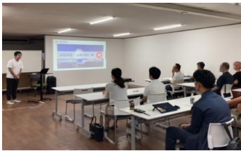
脱炭素ワーケーションのプレゼン大会の様子

効果：企業誘致やワーケーションの実施により、本市の地域経済の活性化、税収の増加、新規ビジネスの創出、関係人口の確保、持続可能なまちづくりへの機運の醸成、新たな雇用の創出や本市への移住・定住が見込まれるなど、様々な効果を見出した。