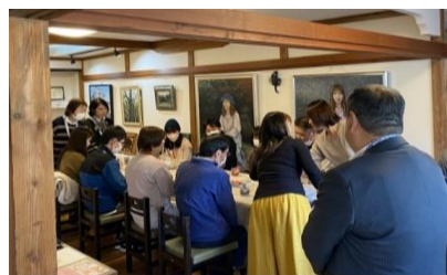
■市主催カップリングパーティー

効果：若い世代が、本市に定住し続けたり、市外から本市に移住してきてくれるような、本市の魅力PRの一翼