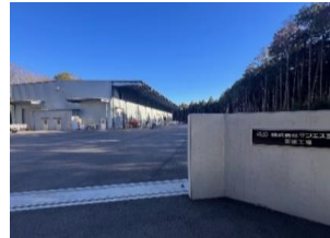
戸崎地内に新設された(株)サンエス工業の茨城工場【R4年度～優遇制度活用】