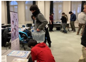
農業次世代技術のマッチング会の様子