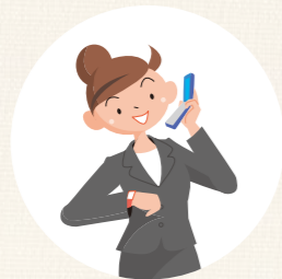
保育施設の時間外や、 学校の放課後などに 子どもを預かる