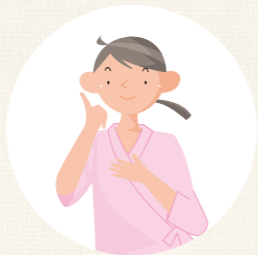
保護者の病気や 冠婚葬祭などの急用時に 子どもを預かる