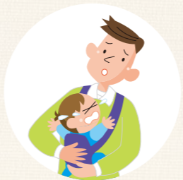
病児・病後児の預かりや 早朝・夜間などの緊急時に 預かる(一部地域で実施中)