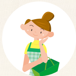
保護者が買い物など 外出の際、 子どもを預かる