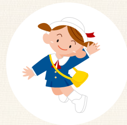
保育施設への 送り迎え