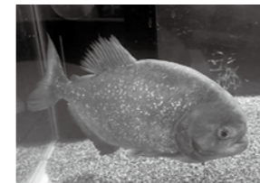
▲水族館で飼育しているピラニア

今回は、当館の外来生物エリアにて展示しているピラニア・ナッターリーを紹介しします。この魚は、南米のアマゾン川を代表する熱帯魚です。