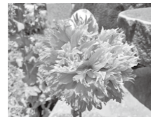
ケシ(八重) 【ソムニフェルム種】

● 葉・茎・つぼみなどの外観は、キャベツの葉のような白味を帯びた緑色をしています。