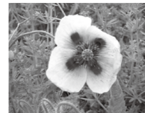
アツミゲシ 【セティゲルム種】

「けし」の仲間は色鮮やかで美しい花を咲かせ、観賞用として人気がありますが、麻薬の原料になることから法律で栽培が禁止されているものがあります。自宅に次のような「けし」が生えているときは、抜去にご協力ください。