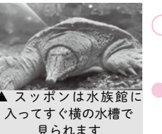
▲ スッポンは水族館に入っすぐ横の水槽で見られます