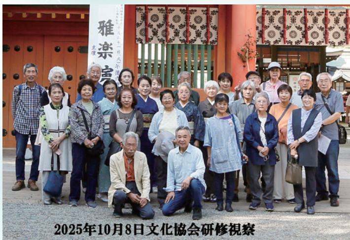
2025年10月8日文化協会研修視察