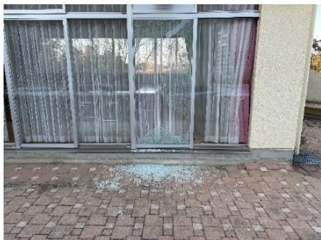
会議室Cの窓ガラスの破損