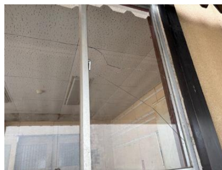
体育館窓ガラスの破損