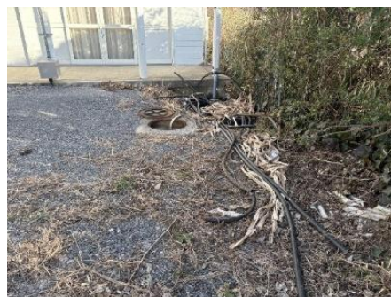
開けられたマンホール