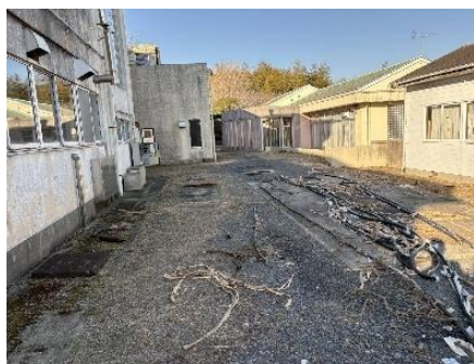
銅線が抜き取られた カバーの残骸