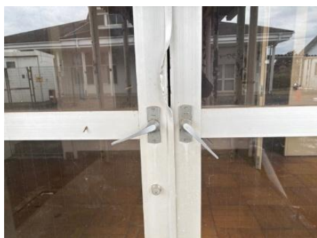
校舎裏口ドアの損壊