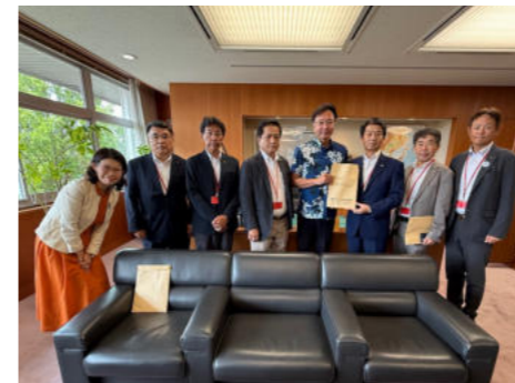
▲国土交通省にて国定政務官(左から5人目)へ要望書提出 ※役職は撮影当時のもの