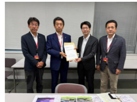
▲関東地方整備局にて河村道路部長(左から3人目)へ要望書提出