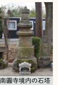
南圓寺境内の石塔