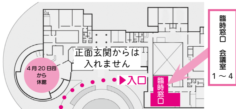
図書館本館(霞ヶ浦コミュニティセンター内) ☎ 029-897-0647