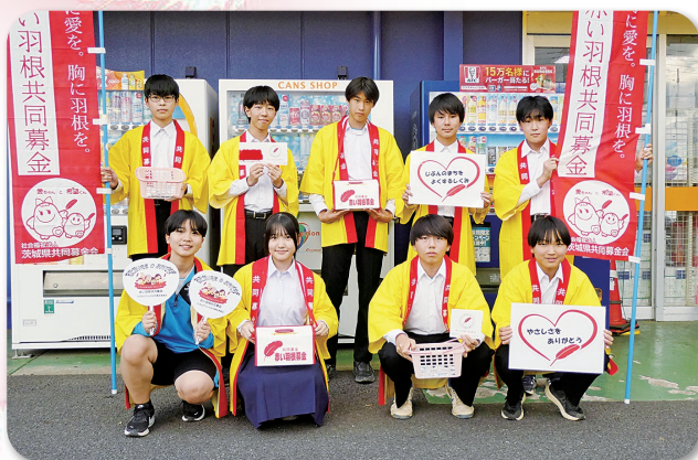
下稻吉中学校の皆さん ディスカウントスーパーヒーロー千代田店にて