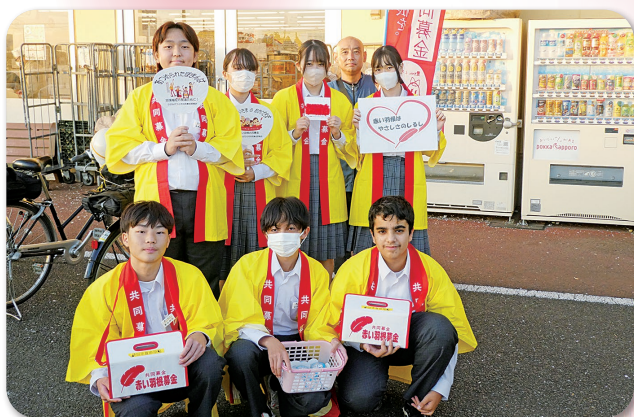
霞ヶ浦中学校の皆さん セイミヤかすみがうら店にて