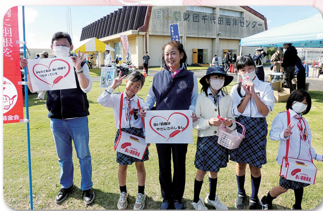
ガールスカウト茨城第3団の皆さん かすみがうら祭会場にて