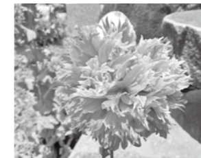
ケシ(八重) 【ソムニフェルム種】

●葉・茎・つぼみなどの外観は、キャベツの葉のような白味を帯びた緑色をしています。