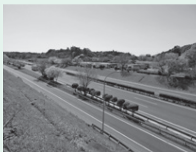
▲千代田パーキングエリア周辺

Q 千代田パーキングエリアスマートインターチェンジの経費1億1120万円を繰り越しているが、関連する市道の設置改良計画を含む進捗状況は。また、集落内を通る県道土浦笠間線の接続箇所付近は狭い。別に道路を取り付けるなどは考えているのか。