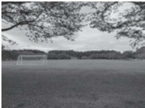
▲戸沢公園運動広場