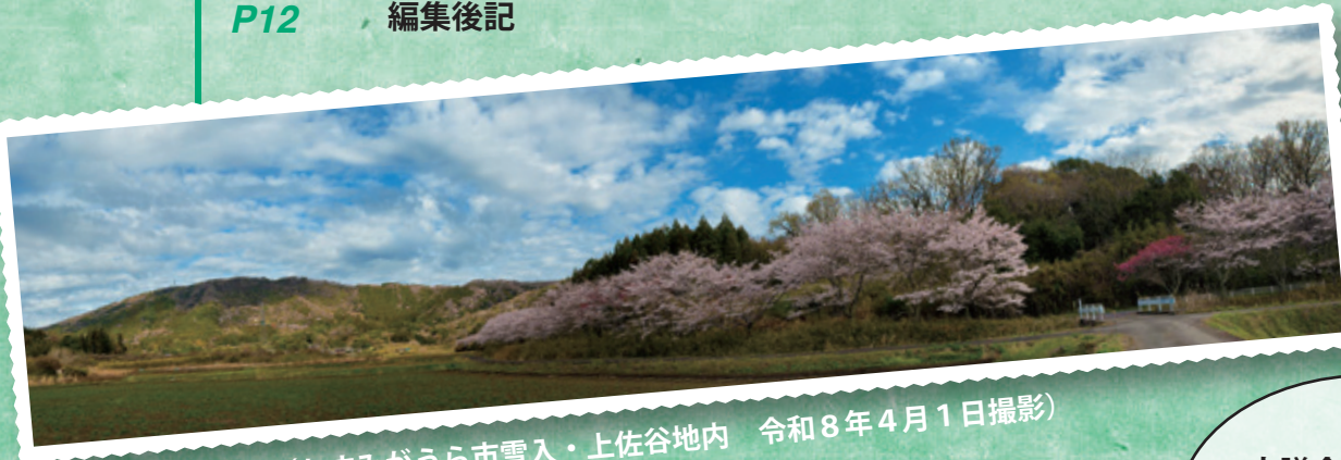
▲雪入山と桜並木（かすみがうら市雪入・上佐谷地内 令和8年4月1日撮影）