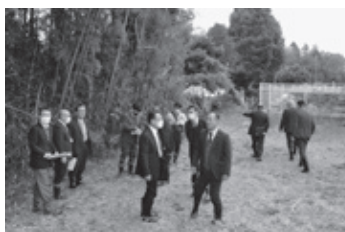
▲市道路線の現地調査 (横堀地内)