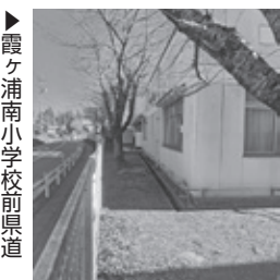
霞ヶ浦南小学校前県道

3 神立駅西口旧筑波ハウス市有地2万8000㎡の活用に向けたサウンディング調査について