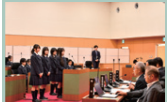
▲令和7年高校生議会の様子

千代田庁舎の3階には、かすみがうら市議会会議場があります。議場では、本会議が行われるほか、令和7年10月は「高校生議会」も行われました。定例会や臨時会は、議場で傍聴することができます。会議のある当日の午前9時より受付しておりますので、ぜひお越しください。 また、市議会ホームページでは、本会議の生中継や録画映像、会議録など、市議会の情報を多数発信しております。本ページ右下のQRコードからもアクセスできますので、ぜひご利用ください。