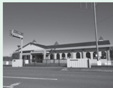
▲市立わかぐり保育所

まずは市立わかぐり保育所で専任の保育士を2名配置し、一般通園児と同じ部屋で実施する予定ですが、民間の保育所にも実施の促進をしたいと考えております。