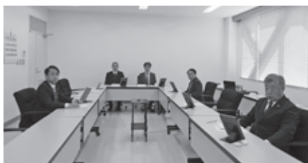
▲説明を受ける委員 (千代田庁舎委員会室)