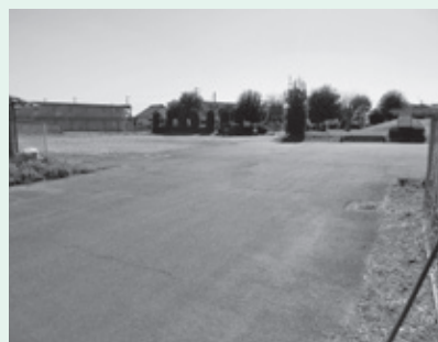
▲勤労青少年ホーム跡地 (逆西第一児童公園脇)

現在の勤労青少年ホーム跡地は碎石敷で、駐車はできません。イベントがあった場合の駐車場については、使用許可を随時出しながら対応しておりますので、現時点では、駐車場として活用していただいて大丈夫という判断でおります。