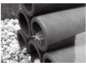
▲館内飼育のホトケドジョウ

ホトケドジョウの魅力大解剖！ 今回は、少し変わったドジョウの仲間「ホトケドジョウ」の魅力をご紹介します。 ホトケドジョウは、本州から四国の一部に分布している日本固有種のお魚です。主に流れの緩やかな水田や農業用水路、小川などに生息しており、きれいな水環境を好んで暮らしています。 見た目は全体的に丸みを帯びており、一般的なドジョウとは少し異なります。顔つきや体形はどこかナマズを思わせるような可愛らしさがあり、じっくり観察すると独特の魅力を感じることができます。また、体色は落ち着いた茶色系で、水底の環境に溶け込みやすい保護色にもなっています。 ドジョウは泥に潜って生活するイメージがありますが、ホトケドジョウは水草の間や石の下などに隠れながら生活しています。時には水槽の中層をふわふわと泳ぐ姿を見ることもでき、他のドジョウとは違った行動を観察できるのも魅力のひとつです。 食性は雑食性で、自然界ではユスリカの幼虫やトビケラなどの水生昆虫、小型の生き物、藻類など幅広いものを食べています。水族館では沈下性の餌や赤虫（ユスリカの幼虫）を与えており、元気に食べる様子を見ることができます。 一見すると地味なお魚に見えるかもしれませんが、よく観察すると他のドジョウにはない魅力がたくさん詰まっています。ぜひ水槽の中で、可愛らしい姿や行動に注目してみてください。 ☒ かすみがうら市水族館 ☎029-896-0722